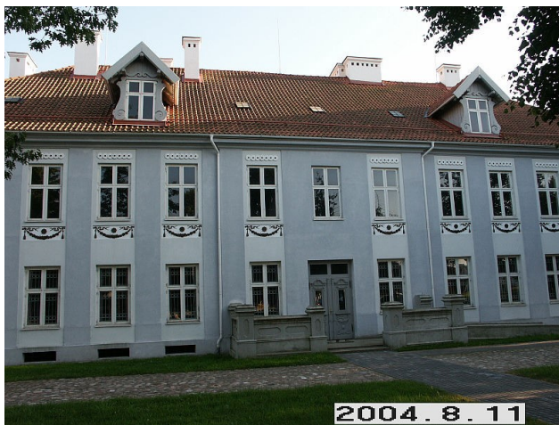
Centriniai Šojaus dvaro rūmai

1. TRUMPAS REGIONINIO KULTŪROS CENTRO PRISTATYMAS (kur lokalizuotas geografiškai, administraciškai, kokiam pastate numato įsikurti, kas pastato savininkas, trumpas pastato aprašymas, istorija ir t.t.)