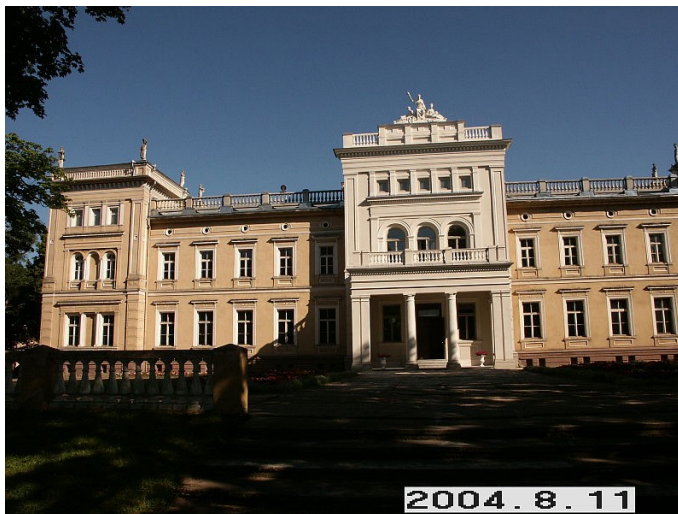
Plungės Oginskio dvaro centriniai rūmai

1. TRUMPAS REGIONINIO KULTŪROS CENTRO PRISTATYMAS (kur lokalizuotas geografiškai, administraciškai, kokiame pastate numato įsikurti, kas pastato savininkas, trumpas pastato aprašymas, istorija ir t.t.).