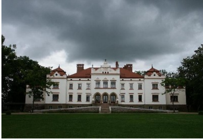
Rokiškio dvaro rūmai